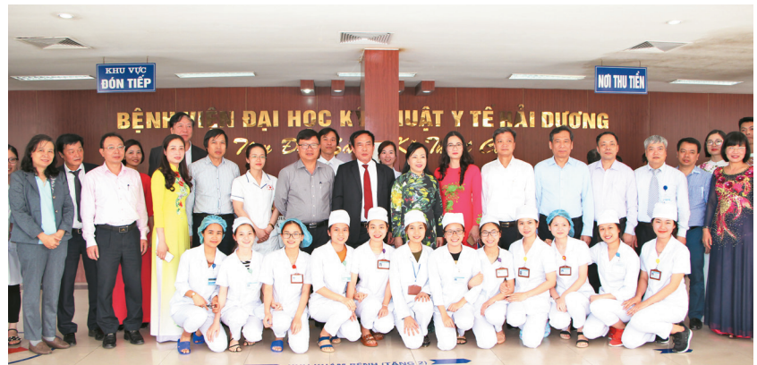
Bộ trưởng Bộ Y tế Nguyễn Thị Kim Tiến chụp ảnh kỷ niệm cùng lãnh đạo và sinh viên trường

Trước buổi làm việc, đoàn công tác của Bộ trưởng Bộ y tế đã thăm Bệnh viện Trường, làm lễ dâng hương tại Tượng đài Đại danh Y thiên sư Tuệ Tĩnh nhân dịp kỷ niệm ngày Đại danh y thiên sư Tuệ Tĩnh viên tịch (15/2 Âm lịch)