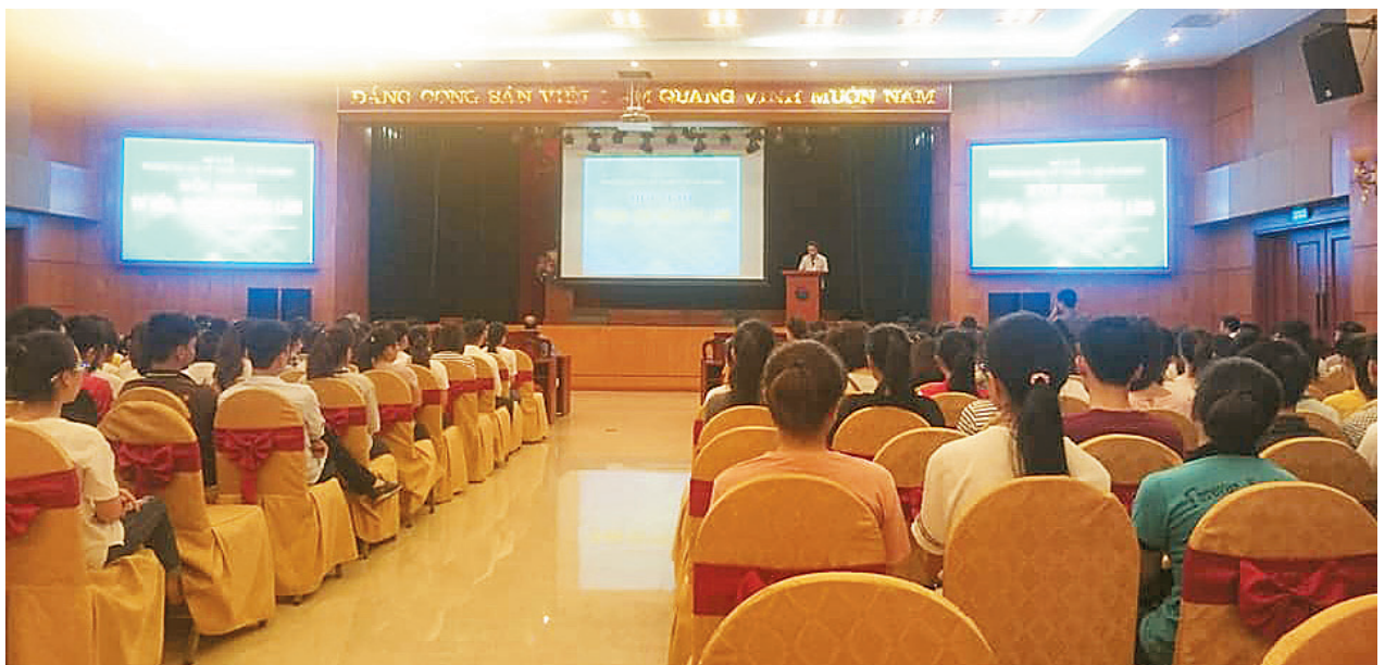
Hội nghị tư vấn – giới thiệu việc làm cho sinh viên