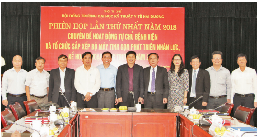
Đại diện Hội đồng trường chụp ảnh kỷ niệm cùng các đại biểu tham dự