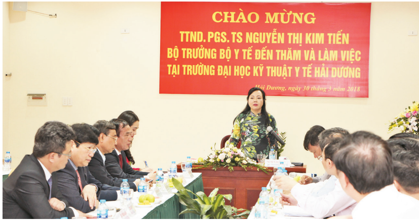
Bộ trưởng Bộ Y tế - TTND.PGS.TS Nguyễn Thị Kim Tiến phát biểu tại buổi làm việc

Chiều ngày 30/3/2018, Bộ trưởng Bộ Y tế TTND.PGS.TS Nguyễn Thị Kim Tiến và lãnh đạo các Vụ, Cục, phòng, ban Bộ Y tế đã đến thăm và làm việc tại Trường Đại học Kỹ thuật Y tế Hải Dương.