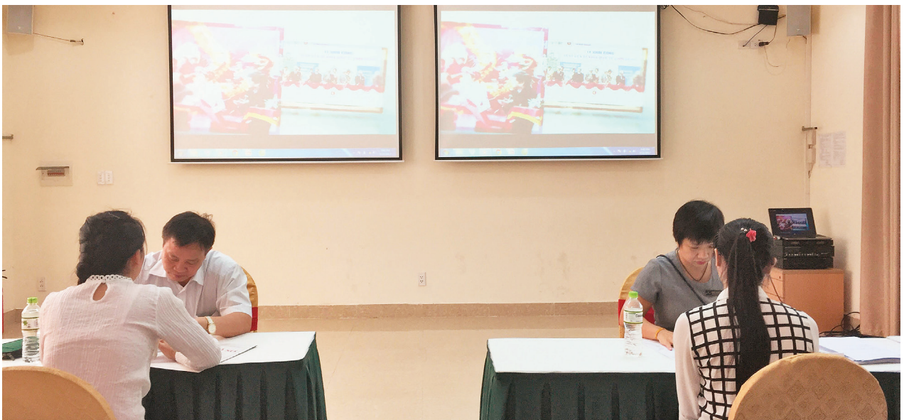
Bệnh viện Đa khoa quốc tế Vinmec phỏng vấn tuyển dụng sinh viên tốt nghiệp Trường Đại học Kỹ thuật Y tế Hải Dương

Trong thời gian tới, Phòng Công tác Quản lý sinh viên sẽ đổi mới phương thức hoạt động, năng động sáng tạo trong công tác tư vấn, hỗ trợ tìm việc làm cho sinh viên sau tốt nghiệp nhằm góp phần đảm bảo chất lượng giáo dục và phát triển của Nhà trường.