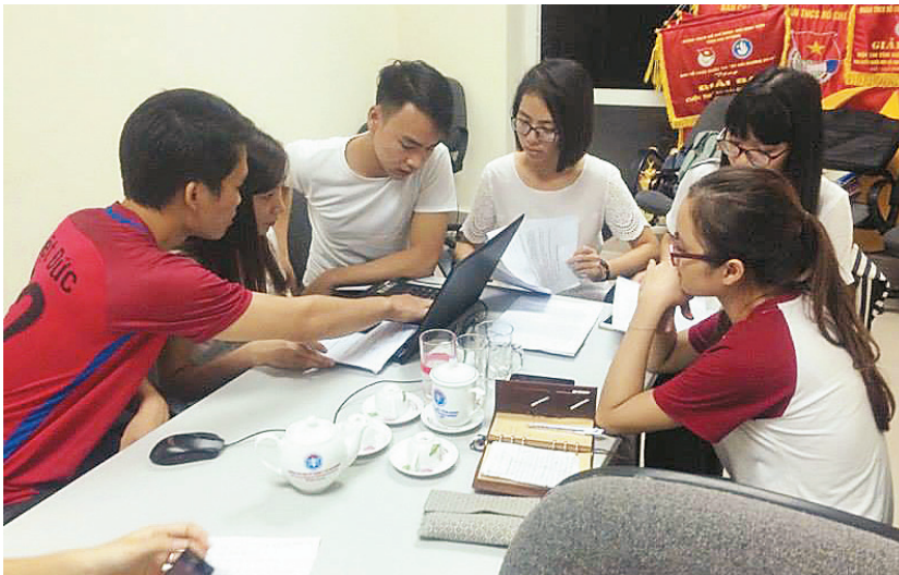
Một buổi sinh hoạt CLB Phát thanh Trường Đại học Kỹ thuật Y tế Hải Dương

tiếng anh, câu lạc bộ phát thanh, câu lạc bộ khát vọng trẻ, đội thanh niên vận động hiến máu, câu lạc bộ thanh niên xung kích, đội văn nghệ nhà trường, câu lạc bộ guitar, câu lạc bộ bóng chuyền... Trong thời gian qua, dưới sự hướng dẫn, chỉ đạo, giám sát hoạt động của Đoàn, Hội sinh viên các câu lạc bộ đã không ngừng lớn mạnh và phát triển vượt bậc đặc biệt là câu lạc bộ tiếng Anh đã thu hút đông đảo đoàn viên, sinh viên tham gia góp phần lan tỏa tới sinh viên toàn trường về phong trào thi đua sôi nổi học tập tiếng anh. Không chỉ vậy, những câu lạc bộ tình nguyện đã góp phần làm phong phú đời sống tinh thần trong sinh viên, đồng thời trau dồi rèn luyện kỹ năng mềm hiệu quả tích cực. Đặc biệt với sinh viên trường y các bạn đã nêu cao tinh thần nhân văn cao đẹp vừa rèn đức luyện tài thông qua các hoạt động của đội thanh niên vận động hiến máu, câu lạc bộ khát vọng trẻ.