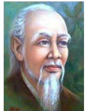
Y tổ của Việt Nam Hải Thượng Lãn Ông - Lê Hữu Trác (1724 – 1791)