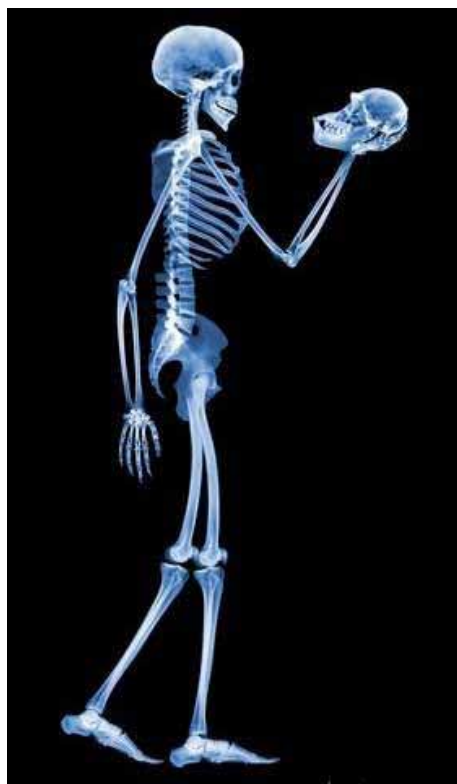
Trông quen quen, ai để quên thế nhỉ?