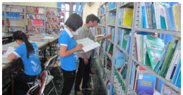
Sinh viên ở thư viện

Tôi đã từng mơ ước được mặc áo blouse trắng vì suy nghĩ và ý thích đơn giản nhưng hôm nay tôi thấy hạnh diện và tự hào được khoác trên người tấm áo ấy, tôi đã nhận thức và thấu hiểu sứ mệnh, nhiệm vụ và ý thức lớn lao về công việc, về nghề nghiệp mình đang theo đuổi. Tôi hiểu để làm tốt công việc quan trọng ấy tôi phải biết hi sinh và cống hiến, hết lòng với người bệnh, coi nỗi đau đớn của người bệnh cũng giống như nỗi đau của chính bản thân mình. Mỗi ngày tôi nhận thấy mình trưởng thành hơn, hôm nay tôi thấy mình tốt hơn hôm qua bởi tôi được học hỏi nhiều điều hay từ thầy cô, bạn bè đồng nghiệp và học hỏi từ cuộc sống.... Các thầy cô của tôi đã làm được, các bạn bè đồng nghiệp của tôi họ đã làm được và tôi cũng sẽ làm được! Là cán bộ y tế tương lai, tôi rất vững tin tôi sẽ xoa dịu các nỗi đau và đem lại nụ cười cho bệnh nhân của mình!