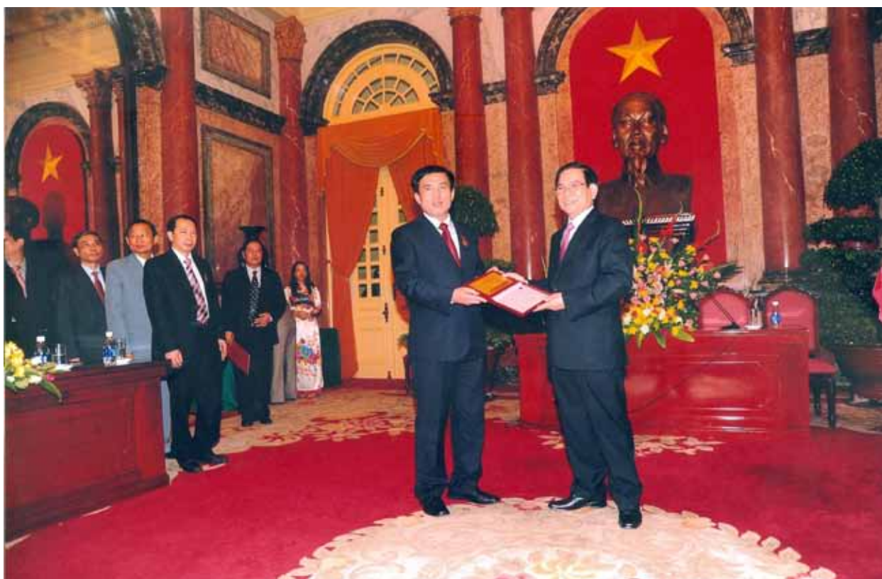
Chủ tịch nước Nguyễn Minh Triết gặp mặt Anh hùng Lao động, Thầy thuốc nhân dân tiêu biểu nhân dịp chào mừng ngày Thầy thuốc Việt nam (27/2/2010)