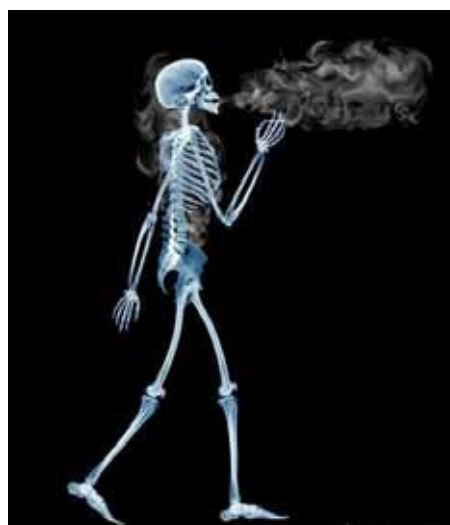
Hút thuốc lá có hại cho sức khỏe