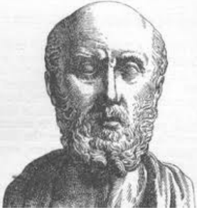
Hippocrates (460-370 tr.CN)

Tôi xin thề trước Apollon thần chữa bệnh, trước Æsculapius thần y học, trước thần Hygieia và Panacea, và trước sự chứng giám của tất cả các nam nữ thiên thần, là tôi sẽ đem hết sức lực và khả năng để làm trọn lời thề và lời cam kết sau đây: