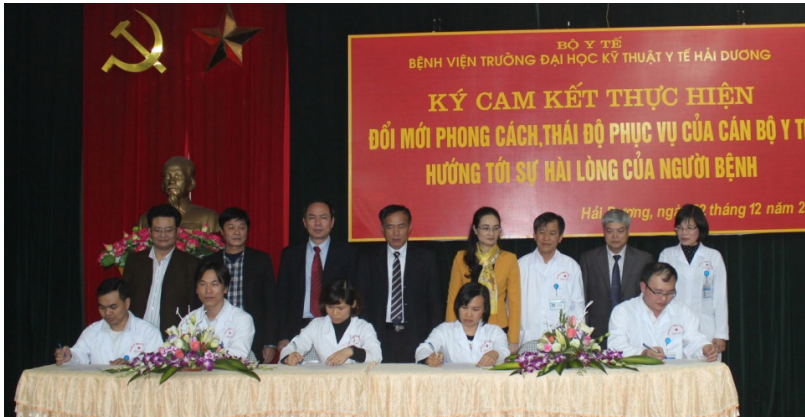
Cán bộ Y tế Bệnh viện trường ký cam kết thực hiện đổi mới phong cách, thái độ phục vụ hướng tới sự hài lòng của người bệnh dưới sự chứng kiến của Ban giám đốc Bệnh viện, Ban lãnh đạo trường