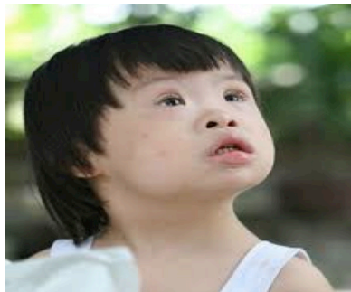
Trẻ bị hội chứng Down

xét nghiệm huyết thanh mẹ định lượng các chỉ số: PAPP-A, fbhCG, AFP, hCG, uE3, inhibin A. Double test là xét nghiệm định lượng 2 nồng độ fbhCG và PAPP-A, Triple test hay còn gọi là 3 test (AFP+ hCG+ uE3), Quadruple test là bộ 4 test (AFP+ hCG+ uE3+ inhibin A). Các xét nghiệm máu của người mẹ sau đó được hiệu chỉnh bằng phần mềm ứng dụng chuyên biệt thông qua các