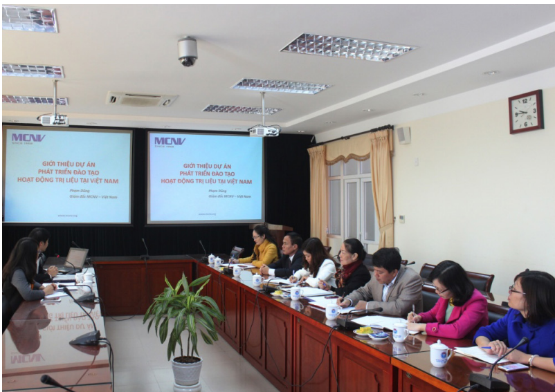
Lãnh đạo trường, các phòng ban và Khoa VLTL/PHCN làm việc với Tổ chức Ủy ban Y tế Hà Lan - Việt Nam