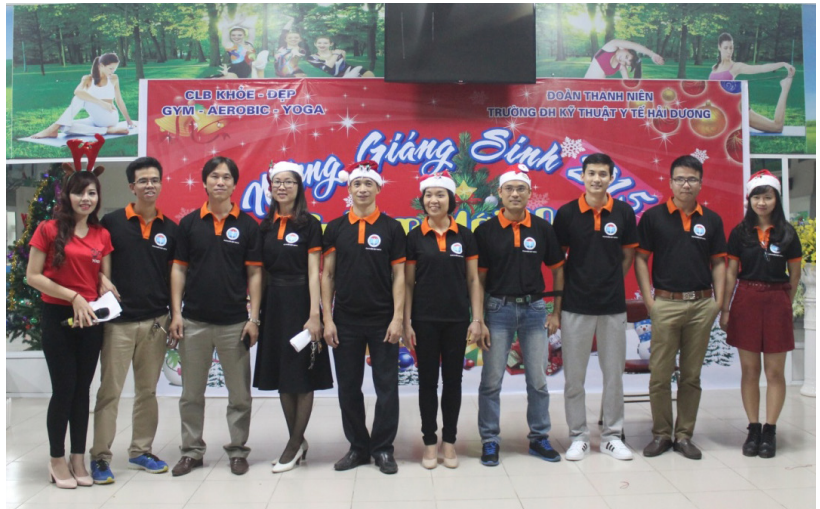
Ra mắt Ban chủ nhiệm mới Câu lạc bộ Khỏe và Đẹp

Kể từ khi thành lập, Câu lạc bộ Khỏe và Đẹp của trường đã tổ chức nhiều hoạt động thể dục thể thao bổ ích như Aerobic, Yoga, Gym giúp mọi thành viên tăng cường rèn luyện sức khỏe, đồng thời cũng là nơi giao lưu, học hỏi và ngày càng thu hút nhiều thành viên tham gia. Buổi giao lưu diễn ra với nhiều tiết mục văn nghệ, nhảy, múa, yoga trẻ trung sôi động và các trò chơi thú vị để lại nhiều ấn tượng trong lòng người xem.