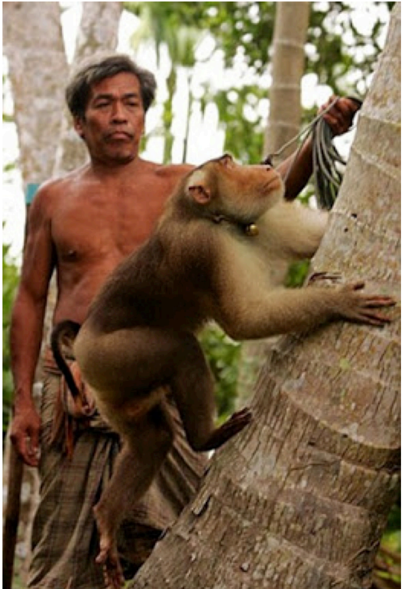
Khỉ được huấn luyện để hái dừa ở Thái Lan, Indonesia và Philippines ...giống như một công nhân thực thụ

Trong thế giới hoang dã, khỉ là một loài động vật thú vị bởi chúng có những mối quan hệ gần gũi với con người và đặc tính giống loài người. Khỉ thuộc loài có vú, sinh con, có 4 chân như : trâu, bò, Ngựa, Dê, Chó, Mèo v.v, nhưng hai chân trước có thể biến thành tay. Khỉ thường sống từng bầy, đoàn ở trong rừng, ưa nhảy nhót, đu chuyền từ cây này sang cây khác. Khỉ hay các loài thuộc họ linh trưởng nói chung được mệnh danh là loài động vật vô cùng