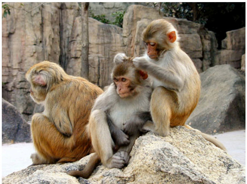
Khỉ thường thể hiện tình yêu thương của mình đến đồng loại bằng cách bắt chấy, rận cho nhau

sống của loài khỉ đôi khi xảy ra rất nhiều tranh cãi. Chúng cũng tỏ ra căm ghét, giận dữ bằng cách nhe răng và nhép môi khi đối mặt với kẻ thù. Đây là hành động đe dọa đối phương và cũng là một cách thể hiện tinh thần sẵn sàng chiến đấu. Không chỉ là loài vật thông minh, khỉ còn là loài vật rất nhanh nhẹn, chúng có thể nhảy xa 20 m, đu qua dòng sông nhiều cá sấu, nhảy từ ngọn cây này sang ngọn cây bên kia, chúng thường suy tính trước khi xử lý vấn đề có khó khăn. Để lấy được món ăn hấp dẫn trên cao, thường biết chổng các khối gỗ lên cao và dùng gậy khuấy thức ăn. Tuy không nói được, nhưng những gì quan trọng chúng đều thông tin cho nhau bằng cử chỉ và nét mặt. Gần đây qua nhiều cuộc thí nghiệm cho thấy khỉ có thể sử dụng Computer,