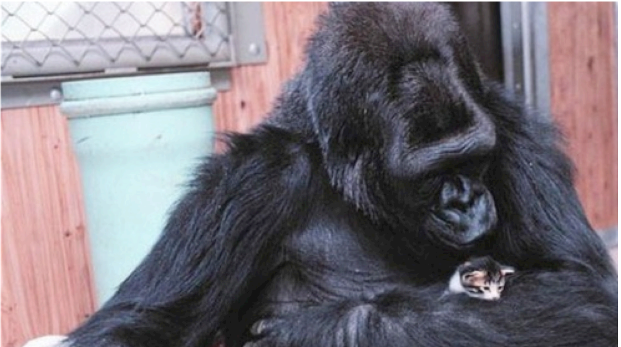
Chú khỉ KoKo đã khóc khi phải xa cách với mèo con mà chú vô cùng quý mến