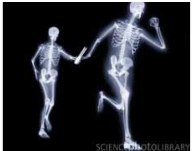
Chạy tiếp sức