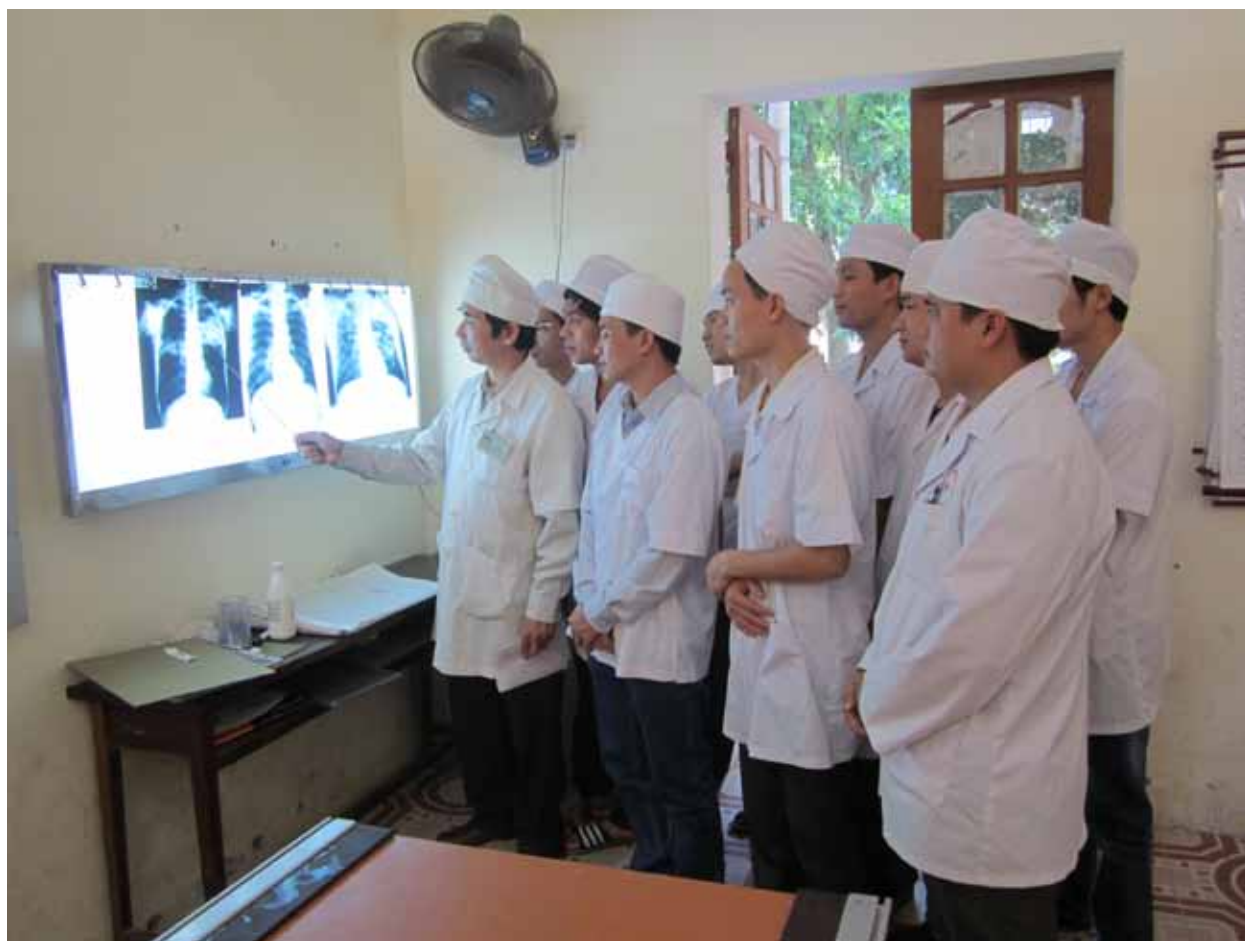
Lồng ghép các tình huống thực tế hướng dẫn sinh viên trong giờ thực tập tiền lâm sàng

trong những nội dung quan trọng trong mỗi học phần, đòi hỏi sinh viên phải tích cực, chủ động hơn trong việc học tập, tự học, tìm kiếm, tích hợp các kiến thức, kỹ năng liên quan để giải quyết vấn đề một cách hiệu quả. Với việc áp dụng phương pháp đào tạo mới, sản phẩm đào tạo của Nhà trường sẽ ngày một chất lượng hơn, đáp ứng với đòi hỏi ngày càng cao của xã hội.