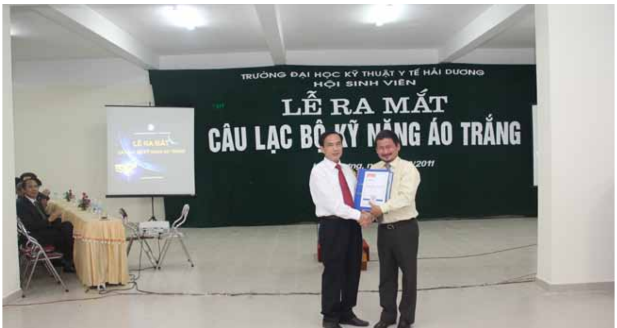
Đại diện Công ty Tâm Việt tặng Trường Bộ tài liệu đào tạo Kỹ năng mềm

Để góp phần cung cấp nguồn nhân lực y tế có chất lượng, việc đưa kỹ năng mềm vào giảng dạy cho sinh viên trong các cơ sở đào tạo y tế là rất cần thiết và quan trọng, đặc biệt là trong thời kỳ hội nhập. Bắt đầu từ năm học 2011-2012, bên cạnh việc đào tạo kiến thức, kỹ năng chuyên môn, Trường Đại học kỹ thuật Y tế Hải Dương đã đưa nội dung đào tạo và huấn luyện kỹ năng mềm vào giảng dạy cho HSSV, thành lập Câu lạc bộ Kỹ năng áo trắng, tạo môi trường hoạt động và mọi điều kiện thuận lợi nhất để HSSV được học tập và rèn luyện kỹ năng mềm. Mặc dù còn nhiều khó khăn về đội ngũ giảng viên, giáo trình và kinh nghiệm giảng dạy, nhưng với tinh thần vượt khó, đổi mới, sáng tạo và sự đón nhận của HSSV, chắc chắn việc đào tạo kỹ năng mềm sẽ mang lại hiệu quả thiết thực, giúp HSSV phát triển tiềm năng cá nhân, thích ứng nhanh hơn với tình hình thực tế và đáp ứng tốt hơn nhu cầu chăm sóc sức khỏe ngày càng cao của người bệnh, gia đình và cộng đồng.