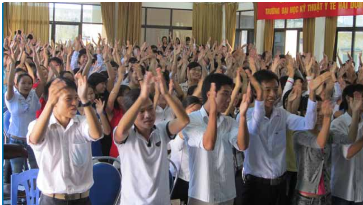
Sinh viên tham gia các hoạt động trong khóa Tập huấn kỹ năng mềm

Hiện nay các giảng viên đang tích cực biên soạn tài liệu giảng dạy, đề cương bài giảng, chuẩn bị các điều kiện cần thiết để đưa môn học vào thực hiện. Theo kế hoạch, việc giảng dạy kỹ năng mềm sẽ được chính thức triển khai vào tháng 3 năm 2012. Với sự quyết tâm của tập thể lãnh đạo, giảng viên, sự cầu thị tiến bộ của HSSV, việc triển khai giảng dạy và học tập nhóm các kỹ năng mềm thiết yếu sẽ góp phần nâng cao chất lượng nguồn nhân lực điều dưỡng và kỹ thuật viên y tế đáp ứng yêu cầu nhiệm vụ đặc thù của ngành y tế đồng thời góp phần nâng cao chất lượng cuộc sống và thay đổi diện mạo con người Việt Nam trong xu thế chung của thời đại.