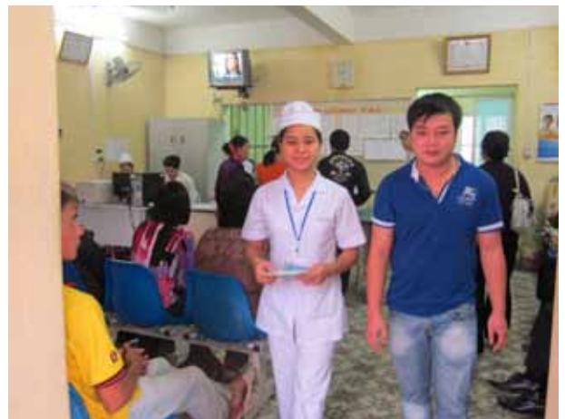
Sinh viên thực tập về tiếp đón và hướng dẫn bệnh nhân tại phòng khám bệnh của Trường